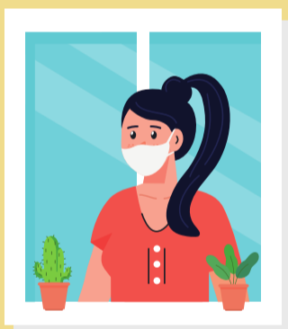
Hạn chế tiếp xúc với người khác

2 Tự theo dõi sức khỏe, trong vòng 28 ngày kể từ khi về từ vùng dịch, nếu có các triệu chứng như: đau đầu, đau cơ, nôn mửa và đau họng, chóng mặt, buồn ngủ, lú lẫn, co giật cần: