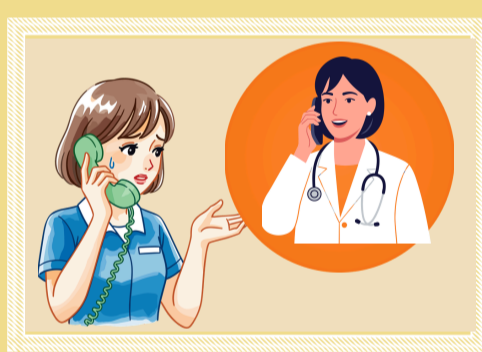
Liên hệ ngay với cơ sở y tế gần nhất