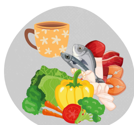
Tiếp xúc với vật phẩm, thực phẩm bị nhiễm vi rút

Để chủ động, phòng chống dịch bệnh do vi rút Nipah Bộ Y tế khuyến cáo người dân thực hiện tốt các biện pháp sau: