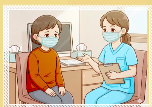
Thông báo rõ tiền sử dịch tễ cho nhân viên y tế

3 Đảm bảo vệ sinh thực phẩm: thực hiện "Ăn chín, uống chín", rửa sạch và gọt vỏ trái cây trước khi ăn, không ăn, uống các loại trái cây có dấu hiệu bị động vật (dơi, chim) cắn hoặc gặm nhấm; tránh uống nước nhựa cây (như nhựa cây thốt nốt, nhựa dừa sống hoặc chưa qua chế biến).