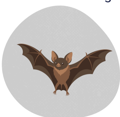
Từ động vật sang người