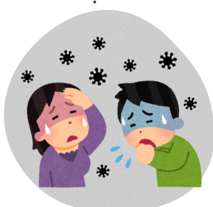
Tiếp xúc trực tiếp với dịch tiết, dịch bài tiết của bệnh nhân